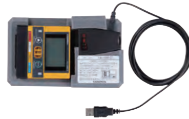
ロギングデータ収集セット (XA-4000IIL) 赤外線通信で、機器本体に蓄積された データをパソコンに取り込みできます。