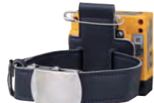
アームベルト (ST-11) ※使用にはベルトクリップ が必要です