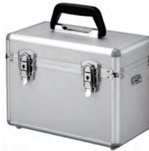
キャリングケース (ALC-3)