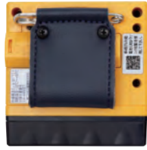
安全ピンアダプタ (C-25)