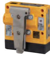
ベルトクリップ [専用ストラップ付] (ST-16)