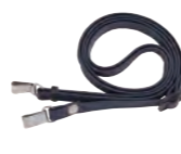
ネックストラップ (ST-15) ※使用にはレーザーケース が必要です